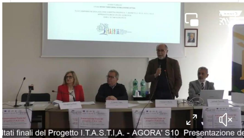
...tati finali del Progetto I.T.A.S.T.I.A. - AGORA' S10 Presentazione de

#itia #servizisociali #RegioneCampania #porcampania #centrofamiglie